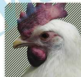
Цианоз гребня и бородачок