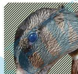
Помутнение роговицы глаз водоплавающей птицы