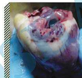
Кровоизлияния и гиперемия сердца водоплавающей птицы

Больную и подозрительную по заболеванию птицу убивают бескровным методом и сжигают, проводят очистку и дезинфекцию зданий и оборудования, помет уничтожают. Осуществляют комплекс прочих противозoonотических мероприятий в соответствии с Правилами по борьбе с гриппом птиц. Правилами лабораторной диагностики гриппа А птиц.