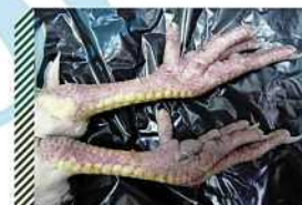
Цианоз лап (посмертный)

острая высококонтагиозная вирусная болезнь, характеризующаяся явлениями септицемии, поражением респираторной и пищеварительной систем, большинства внутренних органов.