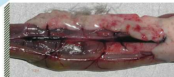
Кровоизлияния и очаги некроза в поджелудочной железе водоплавающей птицы