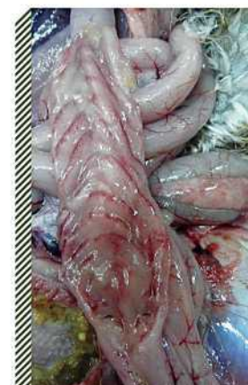
Кровоизлияния слизистой оболочки кишечника водоплавающей птицы