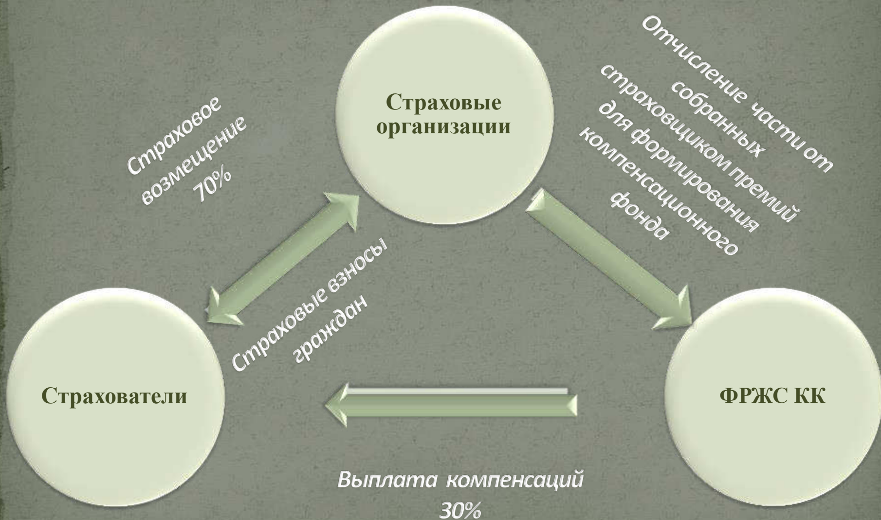
Схема работы единой системы добровольного страхования жилых помещений в Краснодарском крае