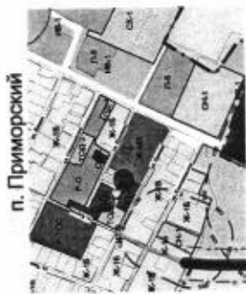
Схема расположения нестационарных торговых объектов на территории Приморско-Ахтарского городского поселения Приморско-Ахтарского района г. Приморско-Ахтарск