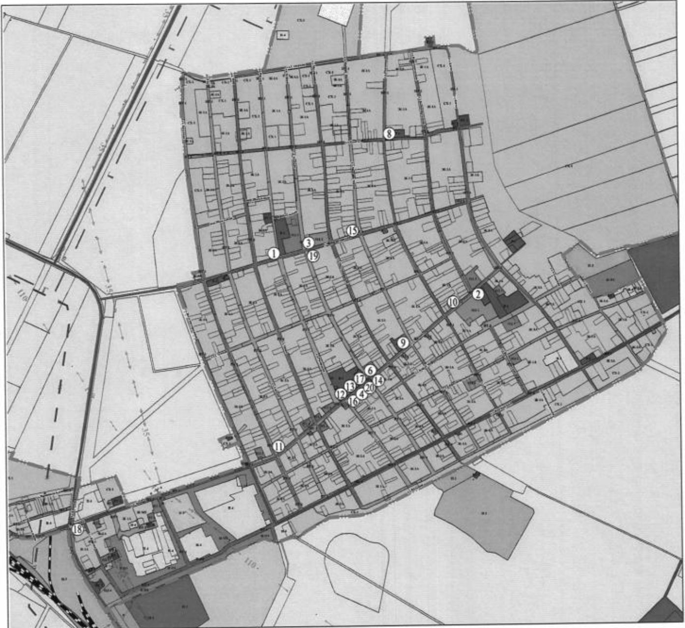
Схема расположения нестационарных торговых объектов на территории Ольгинского сельского поселения ст. Ольгинская