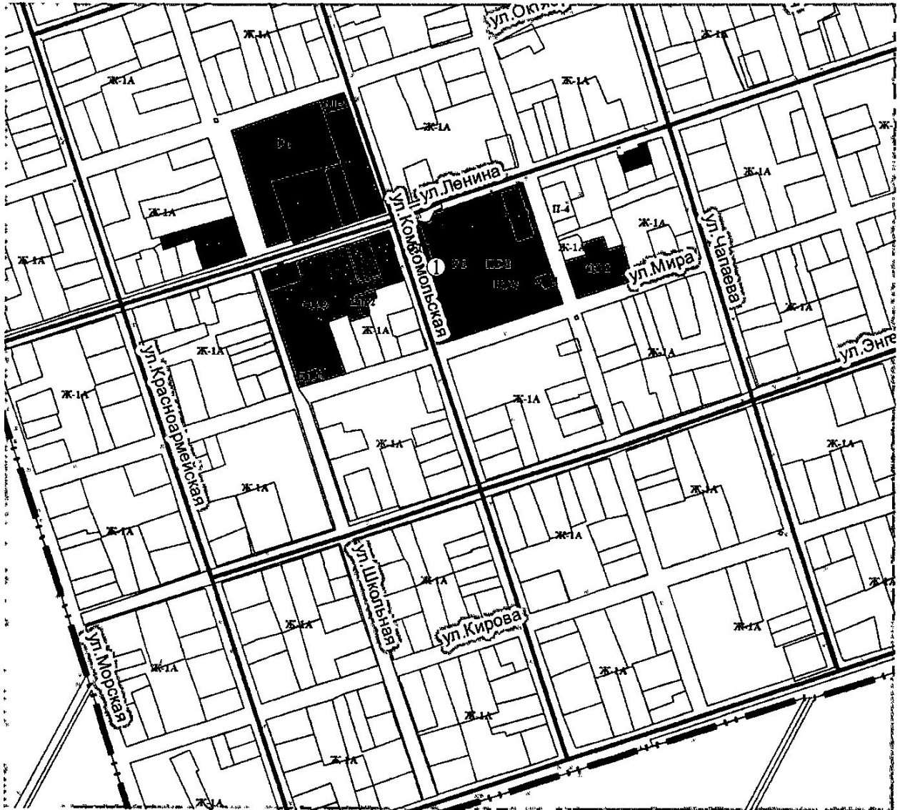
Схема (графическая часть) размещения нестационарных объектов на территории муниципального образования Приморско-Ахтарский район на 2022 год ст. Бородинская